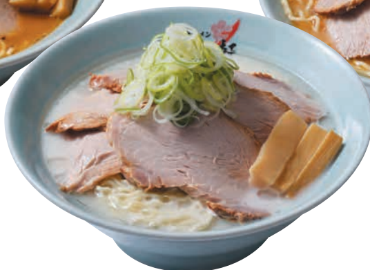
塩チャーシュー Chashu Ramen Salt