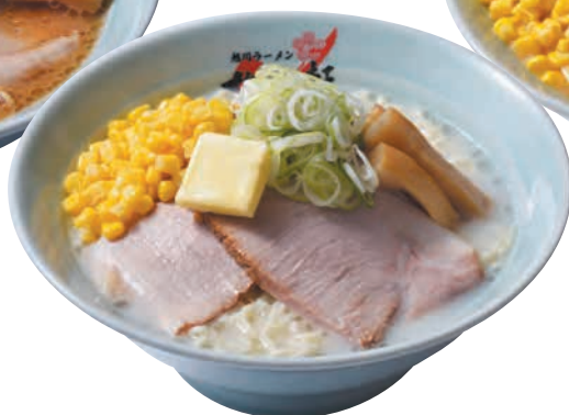
塩バターコーン Butter & Corn Ramen Salt