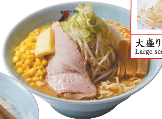
味噌バターコーン Butter & Corn Ramen Miso