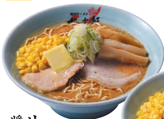
醤油 バターコーン Butter & Corn Ramen Soy sauce