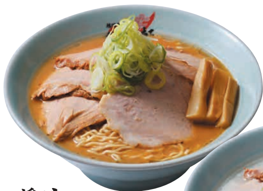
醤油 チャーシュー Chashu Ramen Soy sauce