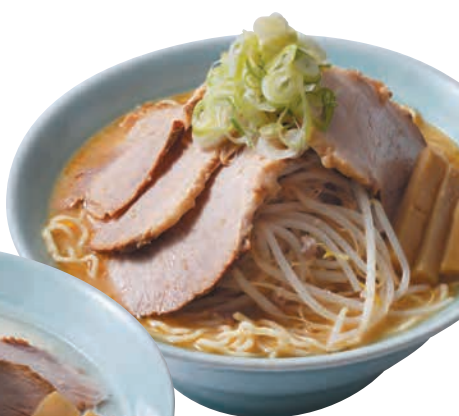
味噌 チャーシュー Chashu Ramen Miso